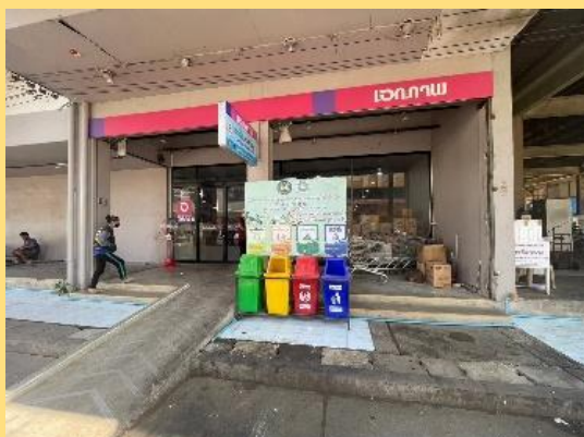
สำนักงานตลาดสาขาหนองม่วง