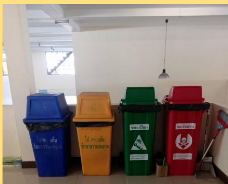
สำนักงานตลาดสาขาลำพูน