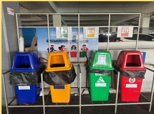
สำนักงานตลาดสาขาลี้ซัน