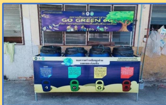
สำนักงานตลาดสาขาบางคล้า