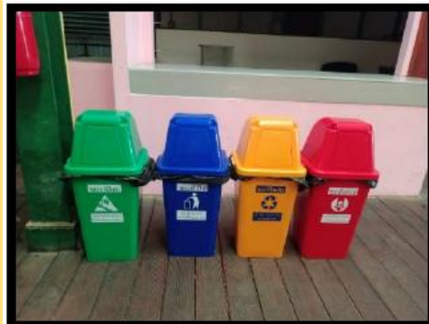
สำนักงานตลาดสาขาปากคลองตลาด